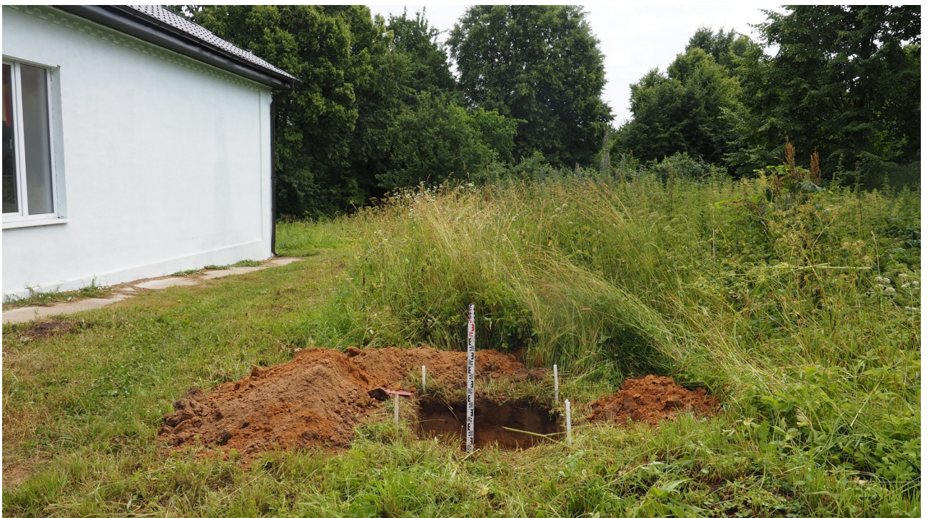
Рис. 16. Калужская область. Ферзиковский район. 2022 год. Археологическое обследование земельного участка, отводимого под строительство блочно-модульной котельной по ул. Больничная, 11 в п. Дугна. Вид на выкопанный шурф 1 с запада.