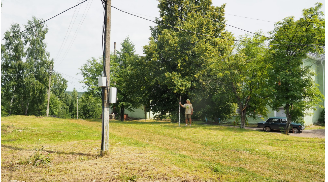
Рис. 13. Калужская область. Ферзиковский район. 2022 год. Археологическое обследование земельного участка, отводимого под строительство блочно-модульной котельной по ул. Больничная, 11 в п. Дугна. Точка фотофиксации 5. Вид с запада-юго-запада.