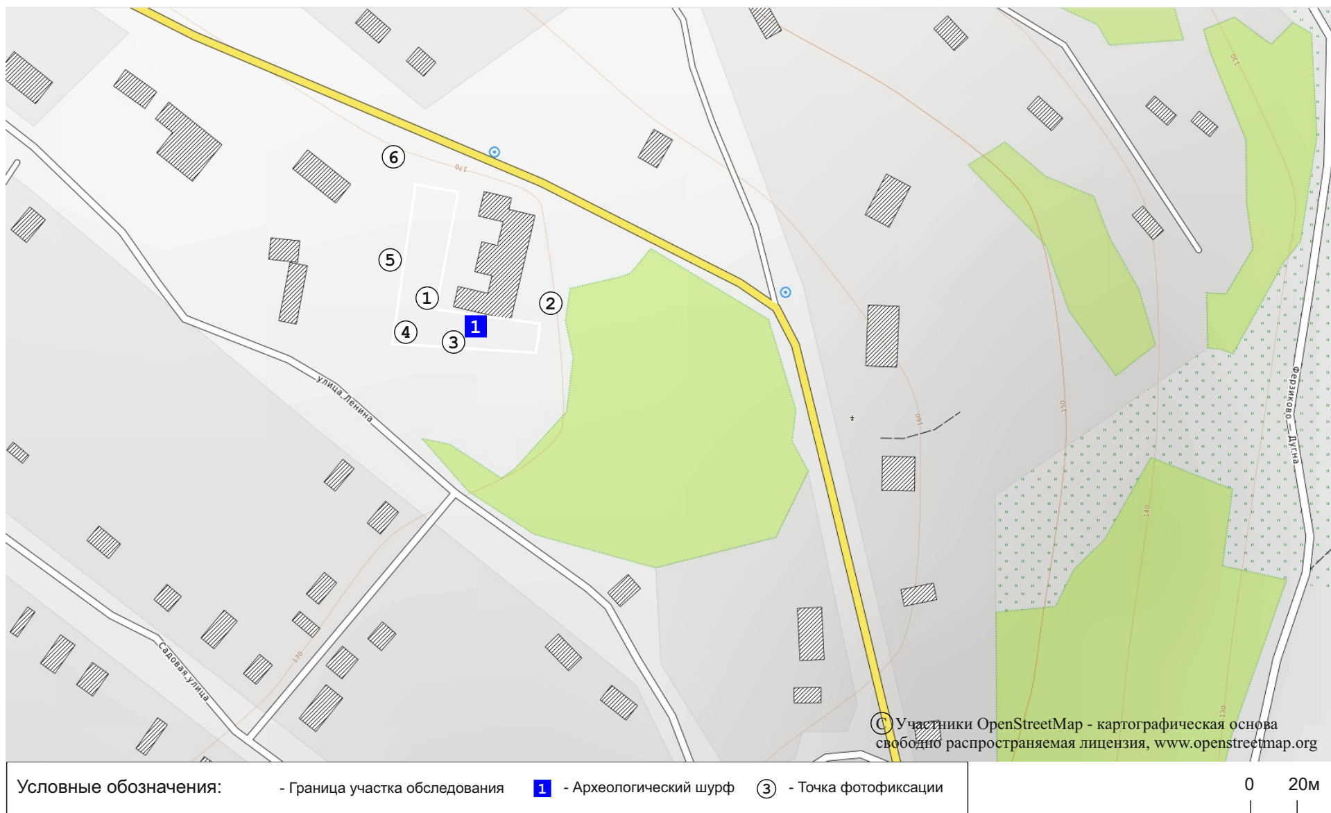
Рис. 7. Участок обследования на топографической карте ОпенСтритМап с указанием места заложенного шурфа и точек фотофиксации.