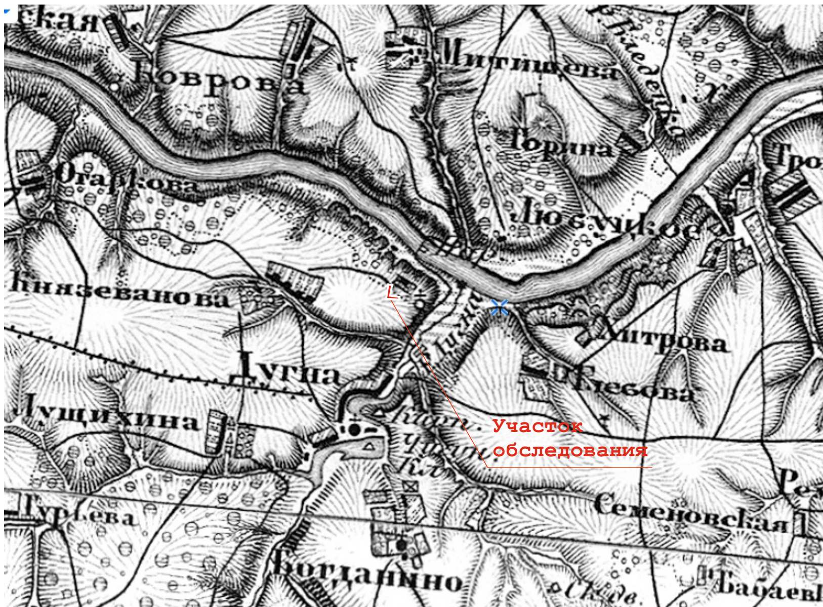
Рис. 6. Участок обследования на карте Военно-топографического депо третьей четверти XIX века.