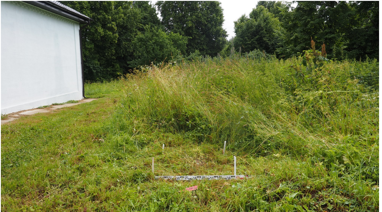
Рис. 15. Калужская область. Ферзиковский район. 2022 год. Археологическое обследование земельного участка, отводимого под строительство блочно-модульной котельной по ул. Больничная, 11 в п. Дугна. Шурф 1 до начала работ. Вид с запада.