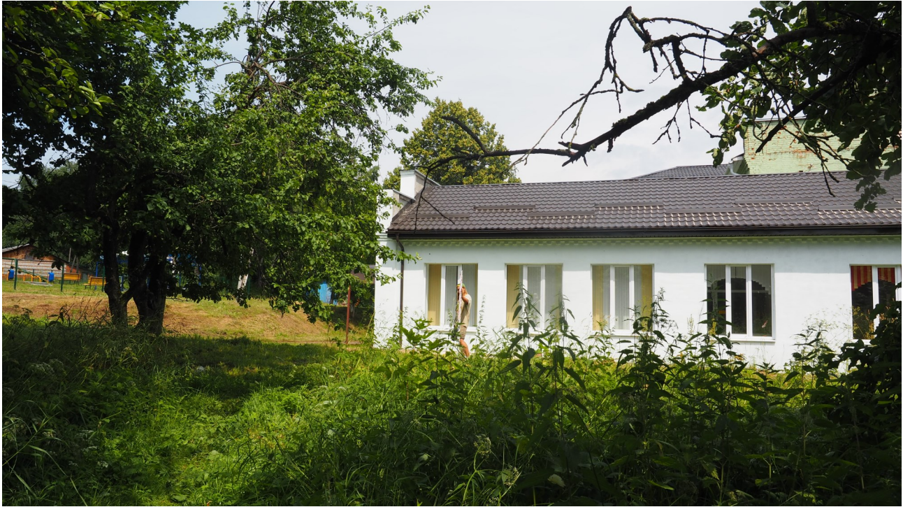
Рис. 11. Калужская область. Ферзиковский район. 2022 год. Археологическое обследование земельного участка, отводимого под строительство блочно-модульной котельной по ул. Больничная, 11 в п. Дугна. Точка фотофиксации 3. Вид с юга-юго-востока.