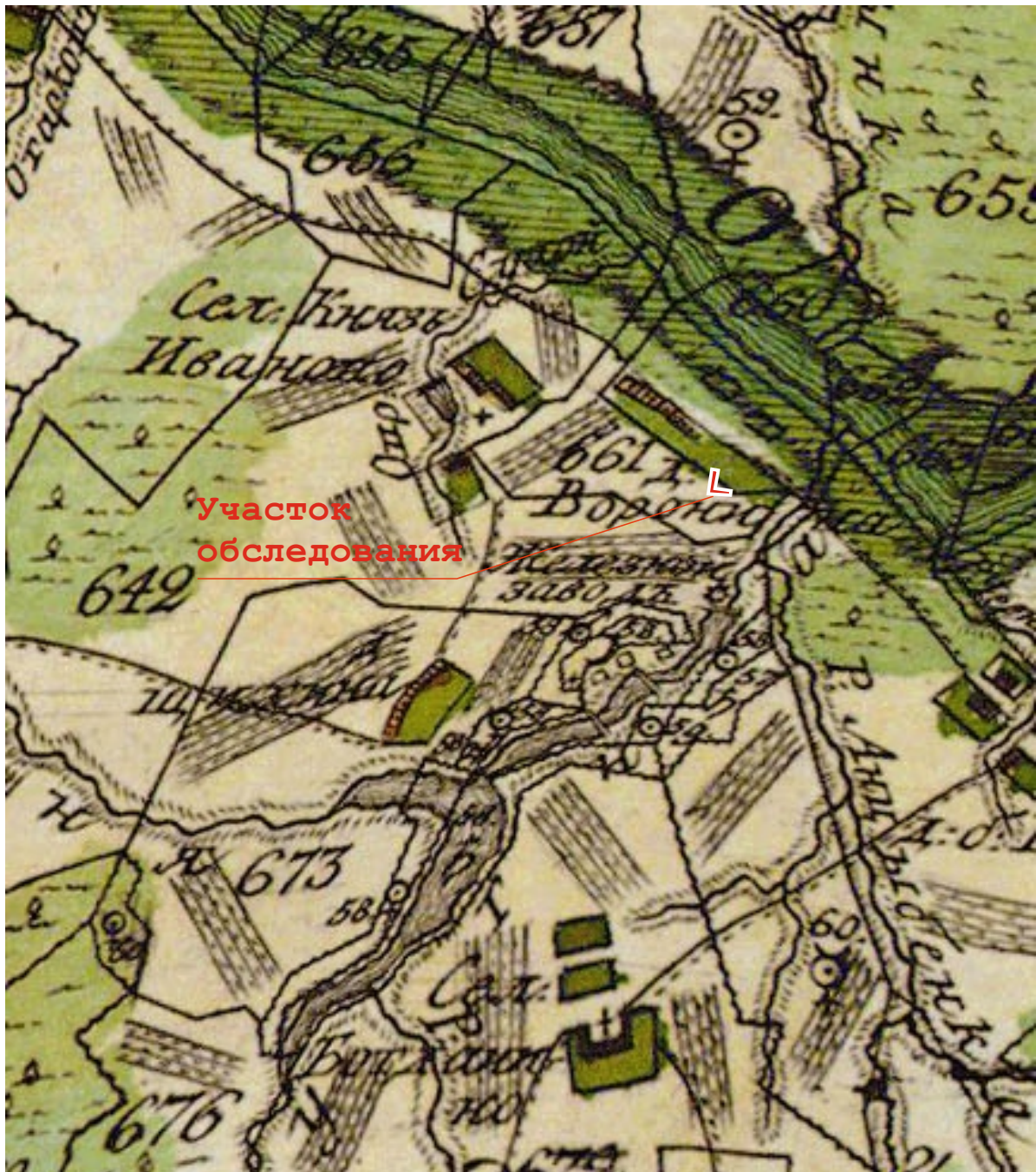
Рис. 5. Участок обследования на Плане генерального межевания второй четверти XVIII века.