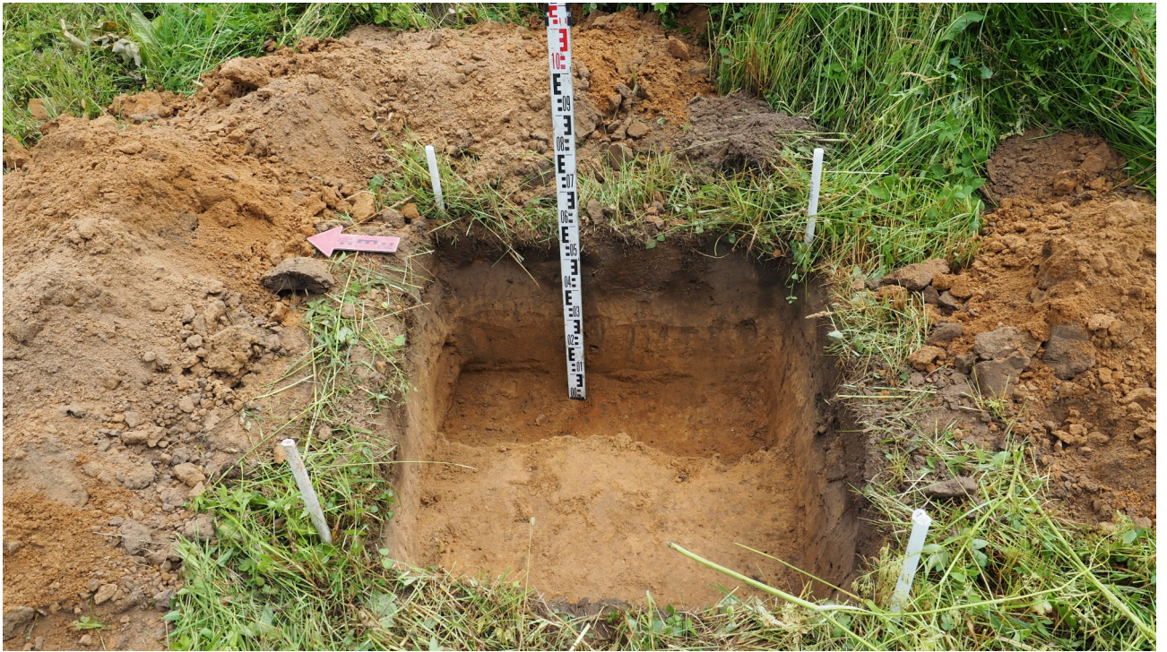
Рис. 17. Калужская область. Ферзиковский район. 2022 год. Археологическое обследование земельного участка, отводимого под строительство блочно-модульной котельной по ул. Больничная, 11 в п. Дугна. Шурф 1. Восточная стенка. Вид с запада.