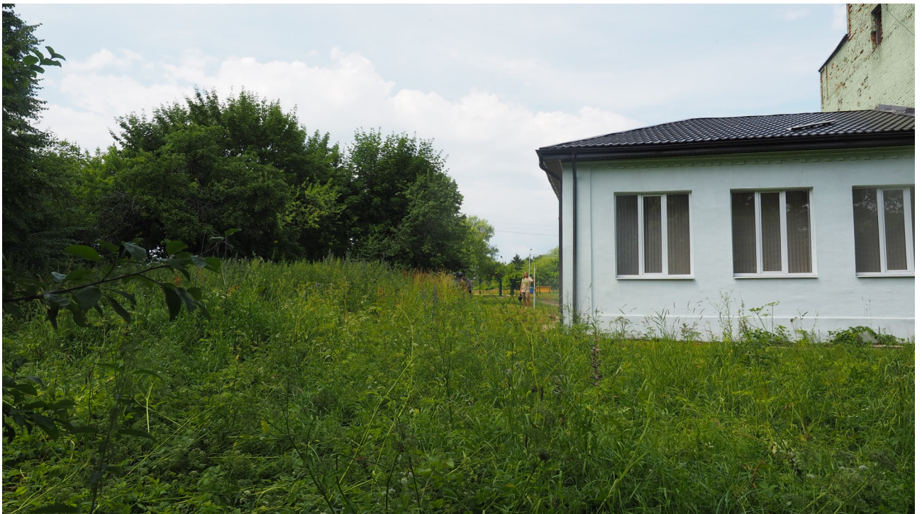
Рис. 10. Калужская область. Ферзиковский район. 2022 год. Археологическое обследование земельного участка, отводимого под строительство блочно-модульной котельной по ул. Больничная, 11 в п. Дугна. Точка фотофиксации 2. Вид с востока.