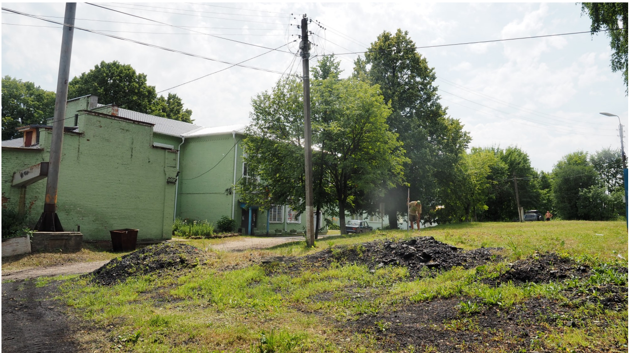
Рис. 14. Калужская область. Ферзиковский район. 2022 год. Археологическое обследование земельного участка, отводимого под строительство блочно-модульной котельной по ул. Больничная, 11 в п. Дугна. Точка фотофиксации 6. Вид с севера-северо-запада.