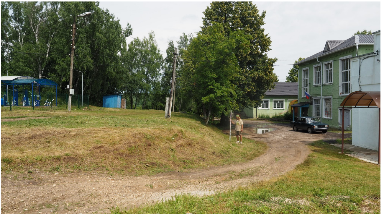
Рис. 12. Калужская область. Ферзиковский район. 2022 год. Археологическое обследование земельного участка, отводимого под строительство блочно-модульной котельной по ул. Больничная, 11 в п. Дугна. Точка фотофиксации 4. Вид с юго-запада.