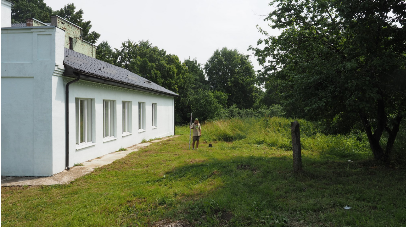
Рис. 9. Калужская область. Ферзиковский район. 2022 год. Археологическое обследование земельного участка, отводимого под строительство блочно-модульной котельной по ул. Больничная, 11 в п. Дугна. Точка фотофиксации 1. Вид с запада-северо-запада.