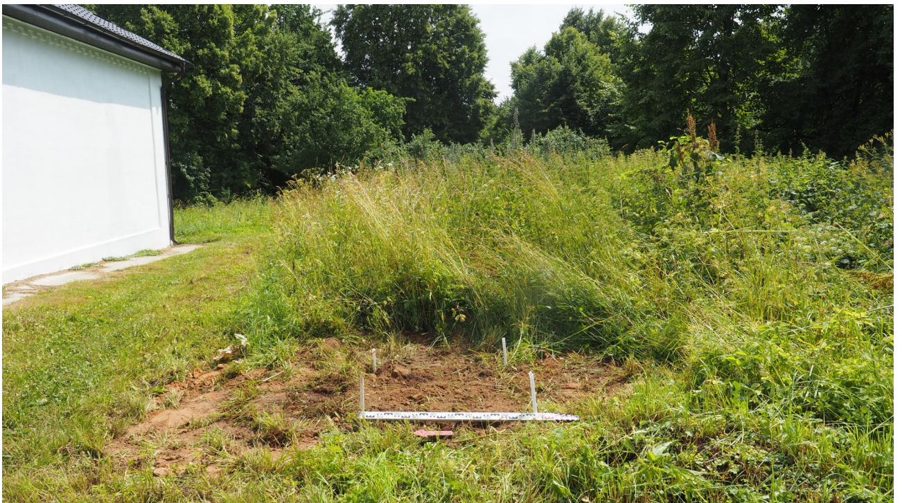
Рис. 18. Калужская область. Ферзиковский район. 2022 год. Археологическое обследование земельного участка, отводимого под строительство блочно-модульной котельной по ул. Больничная, 11 в п. Дугна. Шурф 1 после рекультивации. Вид с запада.